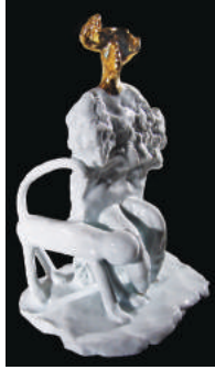
Resim 3: Erdinç Bakla, Çatalhöyük, Mother-Goddess 1. porselen, 25x13x10 cm, 2010.

ilerleyebileceğini” 2 düşünmektedir. Bakla, “kendi özü” olarak nitelendirdiği Anadolu topraklarının farklı dönemlere ait arkeolojik buluntularını kendi plastik anlayışı ile yorumlayarak yeni imgeler yaratmaktadır. Aşağıdaki örnek Çatalhöyük kazılarında esinlendiği çalışmalarındandır.