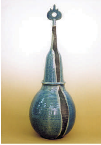
Resim 4: Cemalettin Sevim, Seramik Form, 2000.