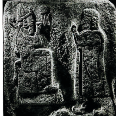
Alaca Höyük Sfenksi, Taş Kabartma, Anadolu Medeniyetleri Müzesi, Ankara.