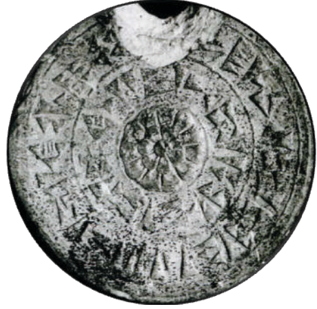
Resim 5: Kamuran Özlem Sarnıç, İzler , 2000. Tuhurvaili'nin mühür baskısı, Anadolu Medeniyetleri Müzesi, Ankara.

Resim: 5'te verilen örnek eserde ise Hitit mühürlerinin imlerini Anadolu topraklarının diğer imleri ile birlikte” İzler ” adını taşıyan seride yorumlanmıştır. Bu eserlerde mühürleme eylemi kavramsal olarak ele alınmış ve Anadolu’ya damgasını vurmuş iki devlet olan Hitit ve Osmanlı’nın izleri imgeleştirilmiştir.