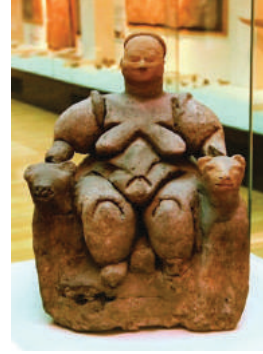
Çatalhöyük Ana Tanrıça heykelciği, Anadolu Medeniyetleri Müzesi, Ankara.