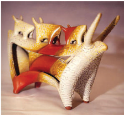
Resim 1: Sadi Diren, Seramik Form. 1987.

Çağdaş Türk seramik sanatında arkeolojik imgelem dendiğinde belki de ilk akla gelen isim Sadi Diren’dir. Sadi Diren; “1953’de İstanbul Güzel Sanatlar Akademisi Seramik Bölümü’nden mezun olur. Davetli olarak gittiği Almanya’da 1964 yılına kadar endüstride tasarımcı olarak çalışır ve bu yıllarda serbest sanatçı olarak yaptığı çalışmalarla uluslararası bir ün kazanır. 1964 yılından başlayarak seramik dersleri verdiği Güzel Sanatlar Akademisindeki atölyesinde, yeni seramik ustalarının yetişmesine öncülük eder”.(Giray, 1998: 27)