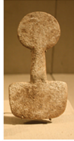
Anadolu'da Bronz Çağında Yapılmış Mermer Tanrıça, Metropolitan Müzesi, ABD.